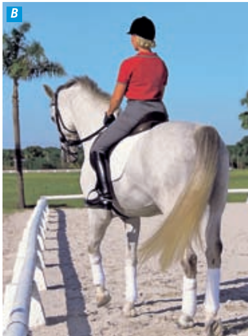
3.17 A & B Im Schritt lasse ich Manhattan an meinem rechten Schenkel an der langen Seite des Vierecks Schenkelweichen. Er ist nur gering gestellt (vorwärts-seitwärts auf zwei Hufschlägen) und ohne Rippenbiegung. (A)

Jetzt lasse ich ihn auf der anderen Hand Schenkelweichen. Schauen Sie, wie weich er am inneren Zügel ist, da Manhattan die Anlehnung am äußeren Zügel akzeptiert. (B)