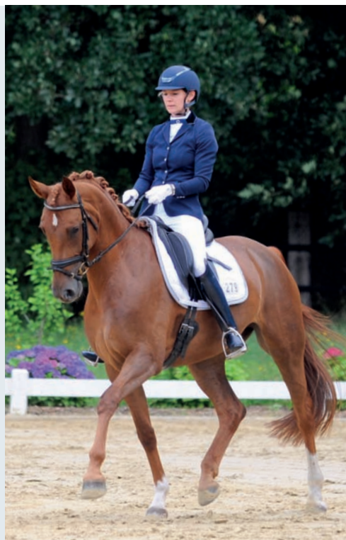
Für eine gute Leistung spielen viele Faktoren eine Rolle.

Dieses Buch soll dem Leser ermöglichen, sich selbst besser kennenzulernen und Strategien zu entwickeln, die die Zusammenarbeit mit dem Pferd optimieren. Viele Faktoren wie Selbstvertrauen, Konzentrationsfähigkeit, Disziplin, Umgang mit Misserfolgen und Ängsten beeinflussen den Reiter und damit den Umgang und die Harmonie mit dem Pferd. Ein losgelassenes Pferd erfordert einen losgelassenen Reiter. In diesem Buch liegt der Fokus auf der mentalen Losgelassenheit, die selbstverständlich nicht unabhängig von der physischen Verfassung gesehen werden kann. Faktoren wie die Koordination, Beweglichkeit und Kondition des Reiters sind natürlich entscheidend, um die richtige Hilfengebung einzusetzen.