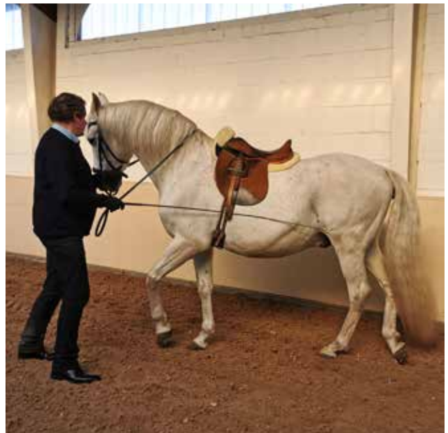
Renvers an der Hand

Die beim Reiten angestrebte Geraderichtung und Durchlässigkeit des Pferdes kann an der Hand durch die Verbindung von Schulterherein und Traverslektionen gefördert werden. Zur Vorbereitung des Renvers hält man das Pferd im Schrittschulterher-