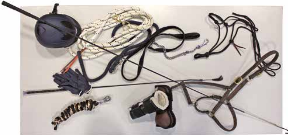
Bei der Bodenarbeit kommen unterschiedliche Ausrüstungsgegenstände zum Einsatz.

gen über Körpersprache, Stimme, mit leicht durchhängendem Strick oder leichten Impulsen über Strick, Bodenarbeitsseil oder Zügel aufmerksam, taktrein und losgelassen mitgehen, deutlich erkennbar willig mitarbeiten und die Übungen zufrieden absolvieren. Die entspannte Grundstimmung ist an einem ruhigen Gesichtsausdruck (Nase, Augen, Ohren) sowie einem gesenkten Hals und nicht zu hoher Körperspannung erkennbar. Der Mensch soll einfühlsam, ruhig, konsequent, fair, im richtigen Moment und mit möglichst geringen, verfeinerten Signalen einwirken.