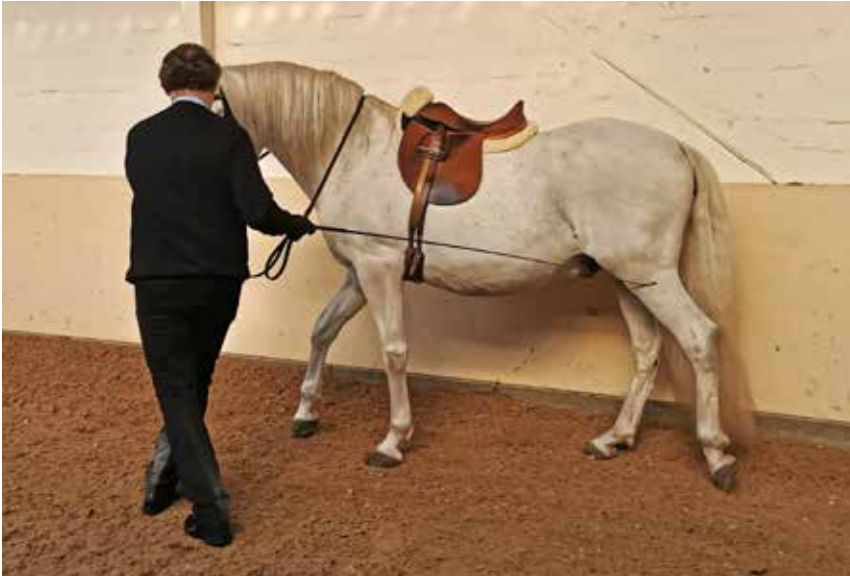
Schulterherein im Schritt an der Hand