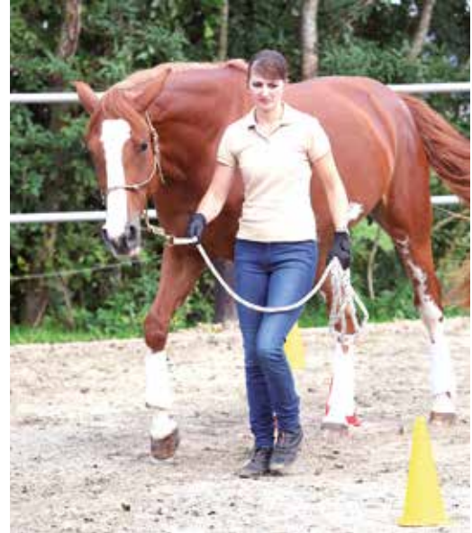
Die rechte Schulter geht in der Wendung leicht nach vorne.