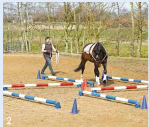
2 Einleiten der Wendung