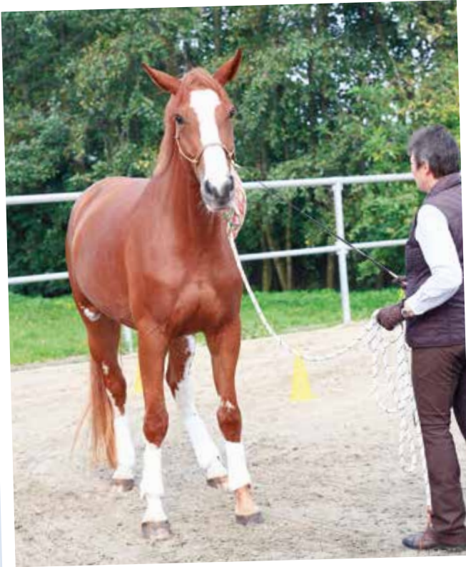
Die Berührung mit dem Wedel – ein Beispiel für die Desensibilisierung

Für einen positiven Lernerfolg ist nicht nur bei dieser Arbeit, sondern generell beim Erlernen neuer Dinge das Timing von herausragender Bedeutung. Die erwünschte Verknüpfung von Reiz und Reaktion ist nur in einem sehr kurzen Zeitfenster unmittelbar nach einem direkten Ereignis möglich. Das Pferd speichert, ähnlich wie der Mensch, im Kurzzeitgedächtnis Situationen ab und durch Wiederholungen gelangen sie in das mittelfristige und dann in das Langzeitgedächtnis. Allerdings hat das Pferd im Gegensatz zum Menschen nicht die Möglichkeit, Erlebnisse über die Sprache auch in der Erinnerung noch zu verarbeiten. Der Faktor Zeit ist daher stets zu beachten. Im Kurzzeitgedächtnis wird vom Ereignis bis zur positiven oder negativen Reflektion nur innerhalb von 1 bis 2 Sekunden ein Bezug hergestellt. An einmal im Langzeitgedächtnis abgespeicherte Situationen können Pferde sich jedoch mindestens 10 Jahre erinnern. Hat das junge Pferd das generelle Handling oder auch die ersten Schritte unter dem Reiter erfolgreich/positiv und stressfrei kennengelernt, so bereitet in der Regel auch nach einer längeren Auszeit die Wiederaufnahme der Arbeit keine Probleme.