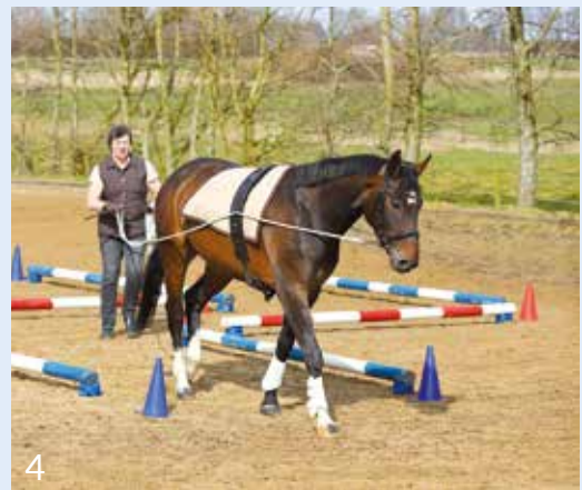
4 Zufriedenes Verlassen der Aufgabe