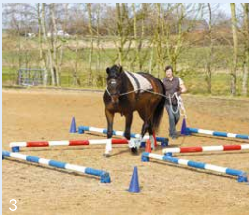
3 Gutes, williges Umstellen in die Linkswendung