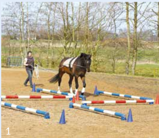
1 Der Eingang zum Labyrinth (Doppel-L)

Innerhalb der Hindernisse muss der Ausbilder ein sehr gutes Timing mit viel Überblick entwickeln, um das Pferd richtig zu dirigieren. Außerdem gehört das längere Halten und Stillstehen mit zur Langzügelarbeit, es ist eine sehr anspruchsvolle Gehorsamsübung, die mit zunehmender Ausbildung auch in neuer Umgebung abgefragt werden sollte.