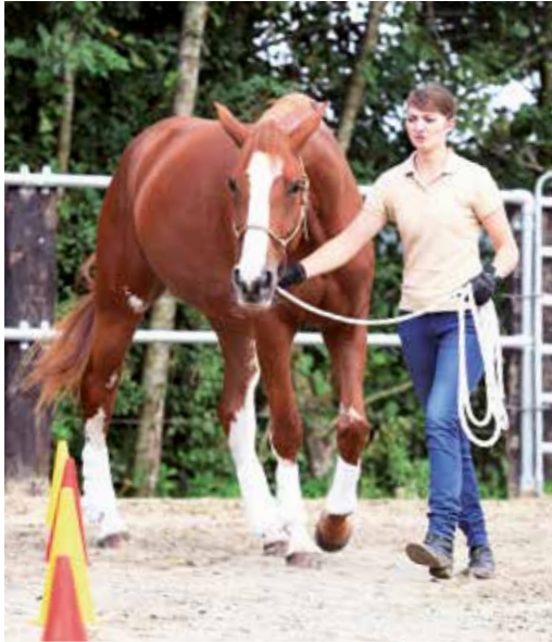
Gute Einleitung der Rechtswendung