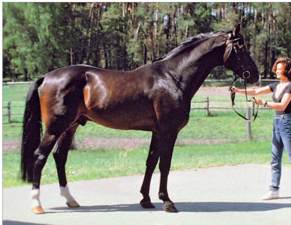
Das Pferd steht zum Betrachter offen, auf festem Untergrund, weitgehend sich selbst überlassen, in natürlicher Haltung.