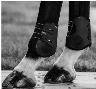
Abb. 22d: Doppelschalengamaschen mit Knopf- oder Hakenverschluss