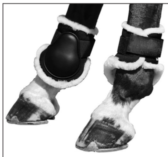
Abb. 22a: Streichkappen mit Klettverschluss