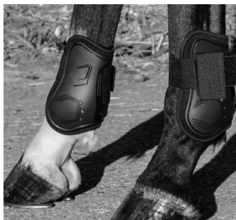
Abb. 22c: Doppelschalengamaschen mit Klettverschluss