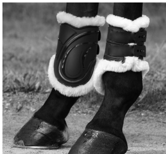
Abb. 22b: Streichkappen mit Knopf- oder Hakenverschluss