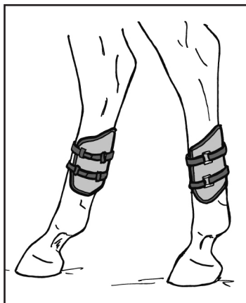
Abb. 55: Beispiel für die nicht korrekte Verschnallung einer zudem gemäß § 70.C.II und IV nicht zulässigen Hinterbeingamasche